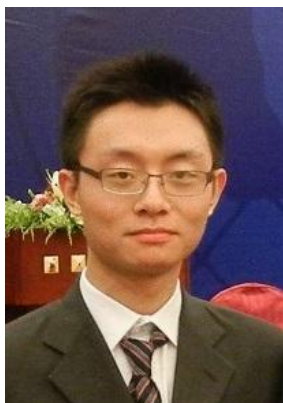
常务副部长 顾宇轩