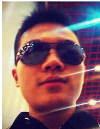
副部长、代理部长 胡湖鹏